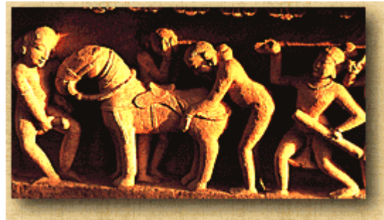
La armada se prepara para la guerra, Templo de Lakshmana

Nadie que examine, como consta en este libro, los medios expuestos en la sección de las esposas de otro, o sea experto en el tratado, tendrá que enfrentarse con que las mujeres le engañan.