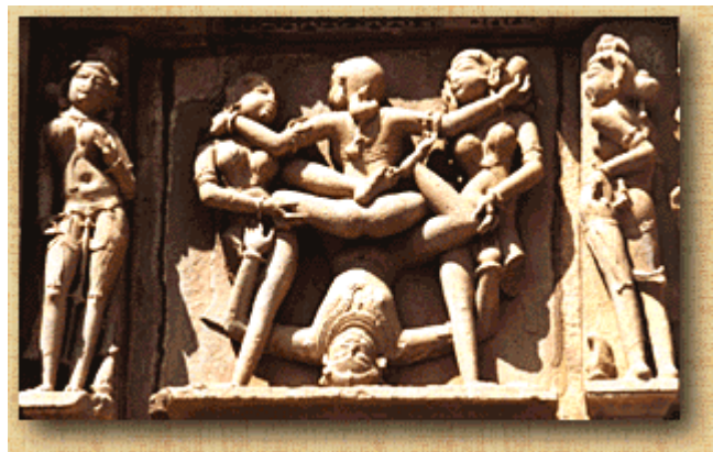
Pareja asistida por dos mujeres, Templo de Kandariya Mahadeva

Esto se convierte en una ventaja para los hombres, si se hace para vigilar a sus esposas; estas normas no son para conocerlas mejor, sino para perjudicar a la gente.