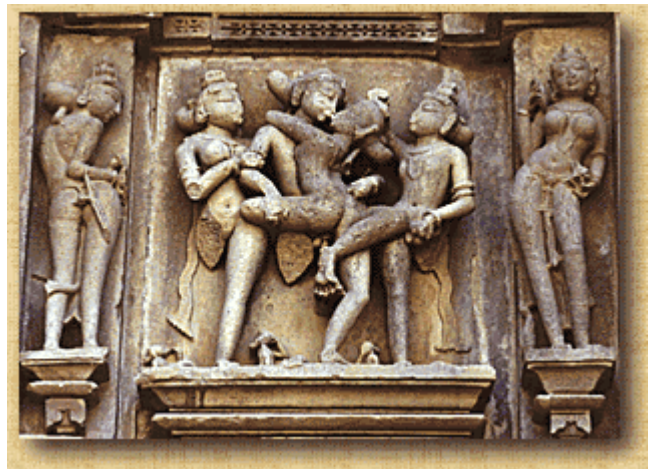
Apsaras rodeando a una pareja que se besa, Templo de Visvanaha

Hay mujeres entregadas a la pasión y mujeres que buscan el dinero; en otra parte de este libro se ha descrito la pasión, en la dedicada a las prostitutas, los resultados que obtienen.